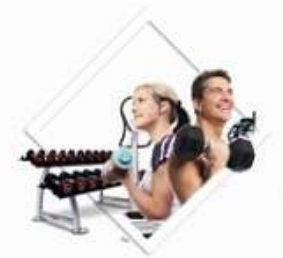
Sportscholen en sportcentra